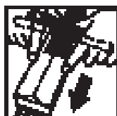
Schiebende Anwendung mit Griff.